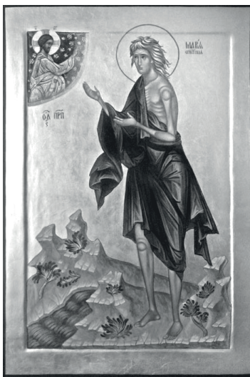
Прп. Мария Египетская

Прп. Мария Египетская входит в нашу задачу сегодня. Мы (безуловно, знакомые с буддистами и йогами) в будущих номерах, возможно, раскроем демоническую суть их «воздержания». Оговоримся лишь о том, что начальник всех грехов – сатана – если уж приобщит кого-то к своей непомерной гордости, то бороть человека другими грехами для него нет уже никакой надобности. Он уже принадлежит ему.]